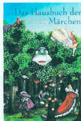
37 Märchen auf einen Streich: Das Hausbuch.

Mit älteren Kindern kann man die Märchen von Hans Christian Andersen lesen, es sind manchmal todtraurige Geschichten. Bei Knauer ist eine bebilderte Sammlung erschienen, 15 Euro. Wer's ein wenig orientalisch mag, für den sind die drei Bände „An Nachtfeuern der Karawan-Serail“ etwas. Die Geschichten alttürkischer Nomaden fangen etwa an: „Höre oh Freund und Bruder...“ – und sind blumig und schön. 19,95 Euro.