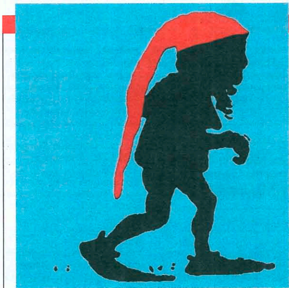
Ein Wesen aus der Alpenwelt?

Donnerstag, 30. Oktober, 20 Uhr, Pflinganserstraße 6, © 54 32 05 13. www.geschichtenerzählerin.d